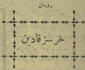
مؤلفی : زورز اوئه