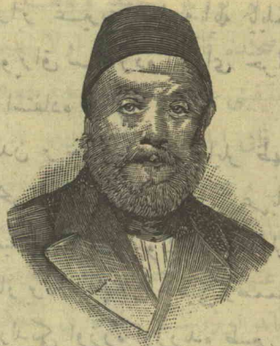
قسطنطين موسوروس پاشا

آندن صکره ۱۳۰۲ سنه سنه قدر لوئدره سفارت سنه سنه قالمش و بو مأموریت معتاده دخی دولت ابد مدتہ خدمات ممدوحه ده بولمشدر .