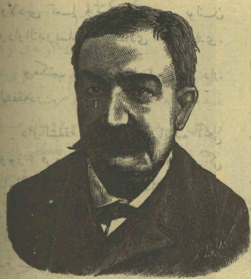
موسیو لهون قاهون

بواقه رق قلمی تکرار اننه آلمش و منافع ممکتی لاجل المدافعه بو صروده (فاردو - لالوار) غزته سی ایله مملکتیمز حقیقده کی انکار باطله نی جرح ورد ایلمش و (دهبا) و (ره ووبلو) غزته لرنده تاریخ و ادبیاته متعلق بر جوق بندلر باصدریمشدر . (۱۸۷۸) ده و (۱۸۸۰) ده تکرار وطنمزی زیارت ایدرک (توردوموند) غزته سنه بندلر و آبروجه کتا بلر نشر المشدر . یازدینی تاریخه متعلق رومانلر صره - سنه فینک لوکیجیلری ، (ماغون) قیودانک سر کدشتی ، مونغوللاری ، اون بشتچی و اون لتچی عصرده کی نورماندیا لیری ، قرطاجا سکرلری ، پورتیکیزلرک قونعویه اسکیدن سیاحتلری ، « آلساس صحنه حیاتی » ذکر ایدم .