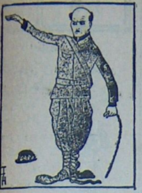
تاریک مشهور دیکتاتورلری : منقل قومیق دارلو آتیلر

نابویون هر مانکی بر ازلرینه برک حانه بوله بیلک ایچون ساعتجه ، کونلرجه قایا بلایرلر . اوله ایکن ، بو عید قیر سزه بر چیریدیه بش نورلوسی بر دن عرض ایش اولورم . آما بکتیرسکر ، بکتیرسکر اوده باشه مشاهد . اگر « کون دو عیالجه » خوشکزه کتیدی و ایلامه نیجه سندن ممنون وله دیکرسه ، سزه کلچک نلنده ن اعتباراً باشلا بچق اولان « مصلدی آرسلان بشنده » ی نومه ایدم . اوله ظن ایدیبورمک سوه سوه اوقوبه چق ویکا دعا ایدم چیکسر . ارجمند اکرم شیدیلک آله امبار لادق . . . جله کره صحتل اولسون !