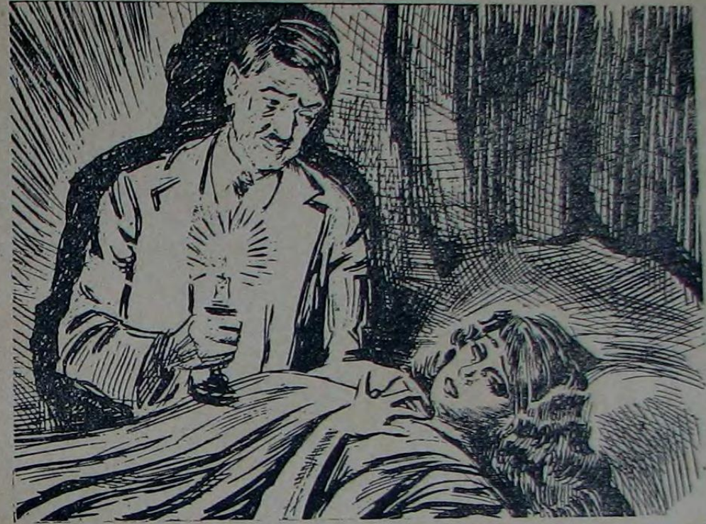
باري آييس اول کوزلنده ايکي دامله باش اولمشدى

ابتدى . بواصيل خانك اولوى بيله باشقه لرينككه بکزه مه مشدى . اختيار خدمتچيستن او کره ندیکمه کوره چوقلرني کوندوزدن کيديرتمش ، ياتديني بردن صاحبليک طارائمنه ، پوتيلرينک باغلامنه نظارت ايتمش ، نهايت مراديه ده کی ياقين بريديکمه کجه ياتيسنه مسافر کوندرمش . بوبلکه اولوى