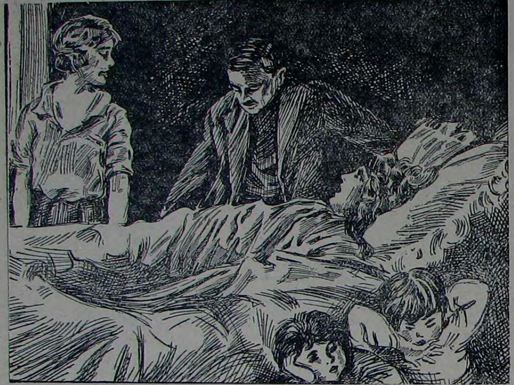
یاتاغنده نفسز لکده بونالیوردی

بو دقیقه ده آرامزده قوتلی بر رابطه ناسس ایتمشدی . آشاییده چکرکه بولندن کین بر آراباده یانیق برسله شرقی سویله نیوردی . بر بریزه سویله یه جک سوز بولامایارق صوصبور و سسی دیکلیوردق . تأثرینک بو بوکله کینه رغمأ بو آکلا شیلما زحر کتنه فنا بر معنای بره جکمدن قورقدی ، ایضاح ایتمک ایسته دی : « بک ایسکی