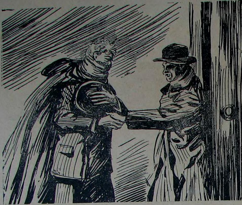
هر شئي بيلديکمي کورمزه بر طور ايله املی اوزاندم

اوقدر ياقين کورمديکي ايجوندى . فقط اولومنده کی سکوته باقارکن بن باشقه درلو دوشونبوردم . ظن ايديبوردم که اطرافنده هيچ بر فریاد ايشتمه دن چوقولرينک ميني ميني يوره کلرينه آنا اولومنگ سيلمز ميجرائي نقش ايمه دن ساکن وساکت اولک ايتدى . في الحقيقه ايجه اسکی اولان مسلکمه هيچ بوقدر ساکن بر اولوم کورمه مشدم . آقشامدن صورکه حرکتلری ، اختلاجلری بوسبوتون دورمشدى . اوداده بدن و اختيار خدمتچيدن باشقه اورته باشلی بر خام دها واردی . اوزون