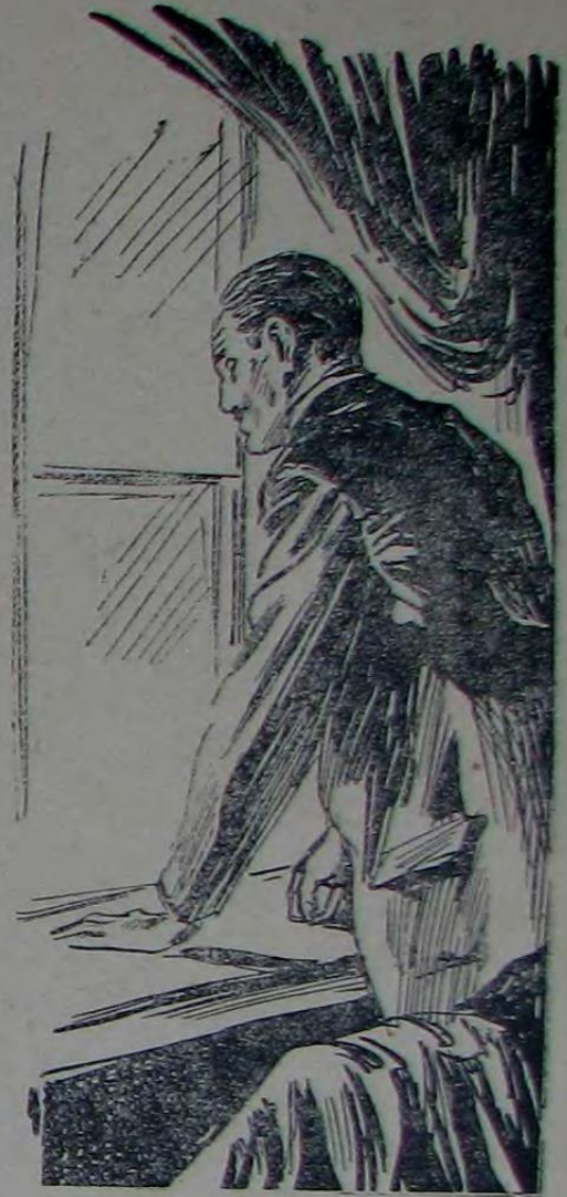
کیمی کچ رفته قدار سر قانگك قار المفی سیر ای بیوردی

بر کیمه مباحه قرشی صیقی صیقی قاپی چالیدلر . بر قچ او آشیرمزه او طوران بر قادی خسته بر دن بره آغیرلاشمش ، بی ایسته عش . خسته او توبش او توب آلتی یاشلرند اویل ونازی بردول خاندی ، بو بره وقاره جکرله قاریشیق ایلرله مش بر قلب خسته لنی واردی . بیچاره بی نهایت صوگ بهاره قدر باشا به به جکی امید ای بیوردی . فقط بی آلفه