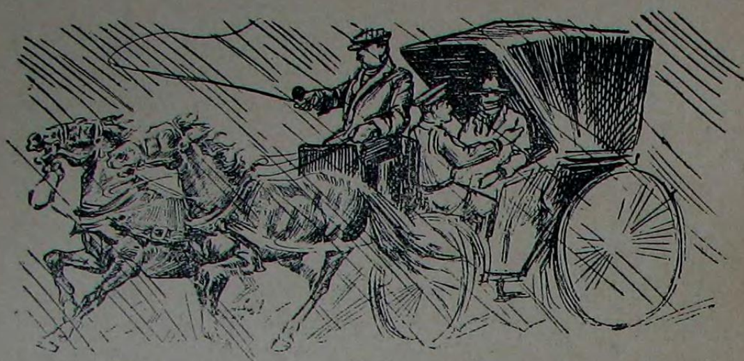
بر هفته سوکرا اوداره کی کویدرک برنده دورنوبوردم

مراقبه مغلوب اولدی : « بن شاشدم سزک جسارتکزه بک افندی ، دیدی ، حفظنا الله کیجه وقتی بویله برلرده دولاشمغه گلز ... » بوسؤاله قارشی هر حالده برشی سویله مک لازم کلپوردی . « هر زمان دکل افندم ، دیدی ، بوکون ناصلسه اولدی ، یاغور بردن بره باصدیردی » کوزلری کبی حلیم وطاتی بر سویله بیچی واردی . اونکله سوکره دن چوق قونوشدم ؛ سسنده ترک ایدلمش چوجوقلرک شکایتنه بکزر خفیف بر تیرته پیش واردی که اونده کز یاده بونی سوادم . بوسوزلردن سوکره تکرار گوشه سنک قارا کلغنه باشنی چکدی . آرتق دمیر طاش استاسیونی کچمش ، شهر بولنه کیرمشدک . سواق فنارلرینک ایشینی مطرد فاصله لرله آرابه نیک ایچندن کچدکجه کوزومک قورویغله باقیوردم . آتقیسنک کنارنده صاری بر اییک طوتای کبی پارلایان صاچلرندن باشقه برشی کورویموردی . سرای اوکنه یا قلاشدیغیز صیره ده بکا « مساعده ایدرسه کز اینه م افندم » دیدی . کیده جکی یره قادر کورومکی تکلیف ایتک ایتدم . فقط رد ایتدی . حالا دوام ایدن یاغورک ایچنده آرابه لرک دوردینی یره یورودی . قومیسر افندی — نه عجایب آدم ، دیور بزه راستلاماسه پدی صاغلام یارینده اونک جنازه نمازینه کیدردک ، دیه کولیوردی . معافیله قومیسر افندی اونک حقدن پک چوقشی بلیوردی . ایکی آیه یاقین بر زماندن بری چکرکه بولنده کی یالکز گوشکلردن برنده کندی . کندینه اوطورویورمش . غالباً کوز دوقتوری ایش . فقط خسته یه فلان باقدینی یوقش ... قومیسر پارماق لرله باره صایه اشارتی یاهرق : — آکلشیلان دنیالی بول ، دیور ، فقط سوکره آغیر آغیر باشنی سالایه رق : — آمان ، آمان اوله باره یرنده دورسون ... نه اوله آچه ، نه اوله صورت . « دیه علاوه ایدیوردی .