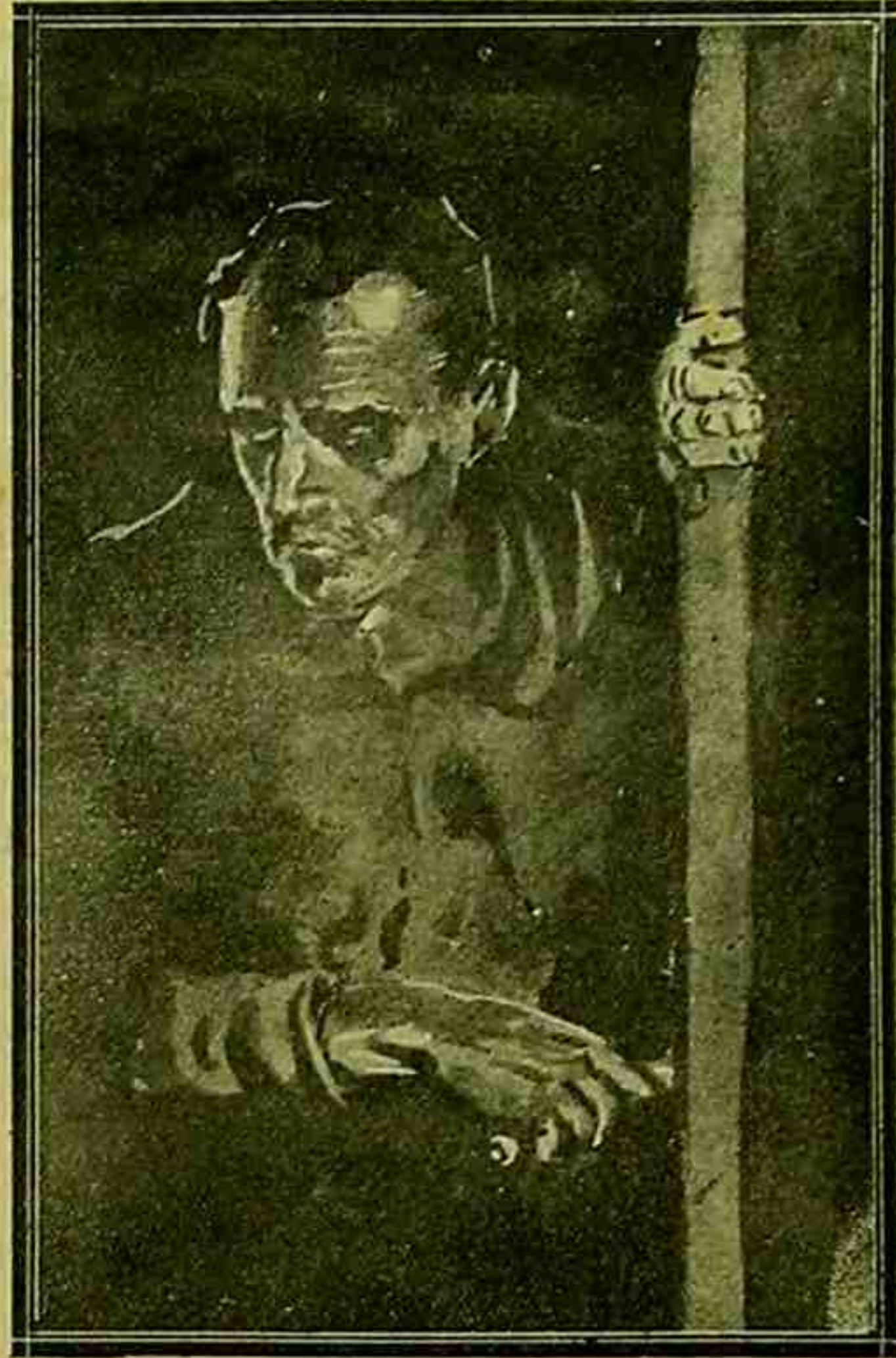
.. بر ساعت قدر اوغراشیلد قمره صوکره قاپو نرنایت آمیلدی

اولدینی حالدی عودت ایتدی . حاجی حسین بک کی تجریه بی بر پولیس مأموری برنجی دغه اولهرق بویه بر وقته قارشینده قالمیوردی . دمبر قاپو کوربر کورمن، درحال یاقینده دکانی بولنان چلیتکیر مانوق کتیرمک اوزره یایچی بوللادی . قاپو اوله ماووک آلات و ادوانی ایله آچیلیر شی دکادی . ریتیر بک اوغلنده براوقاپوسی دکل، عادتا برقله قاپوسی یابدیرمشدی . بونک اوزرینه بوغاز کسندن بر دمیرسی جلب ایدلدی و بر ساعت اوغراشیلد قدن صکره قاپو نهایت آچیلدی . قومیسره اوساچی درحال ایجری کیردیله . دوقنور ریتیر آبواطوطی ایچیه خاشلاقی ، حتی اون سکر سنه لک خدمته باقاپهرق اغلب احوال کندیسی قوغنی نیتنده ایدی . قط دوقنورک بوینی محقق ایتمک محکومدی . زیرا آزار ایشیده جک و حتی اون سکر سنه لک خدمتدن صوکره اودن قوغولوق ذلتندن خاشلا . نه حق آبواطوطی ، بودنیادن کوچن بولونیوردی . اوک برنجی قانده کی او طه سنه کیر کیرمن ، قومیسر دوقنور ریتیر اوله نسیج بر منظره قارشینده قالدیرک آبواطوطی ، قاپو آچانقده مذکور کورمه مک قابل دکادی .