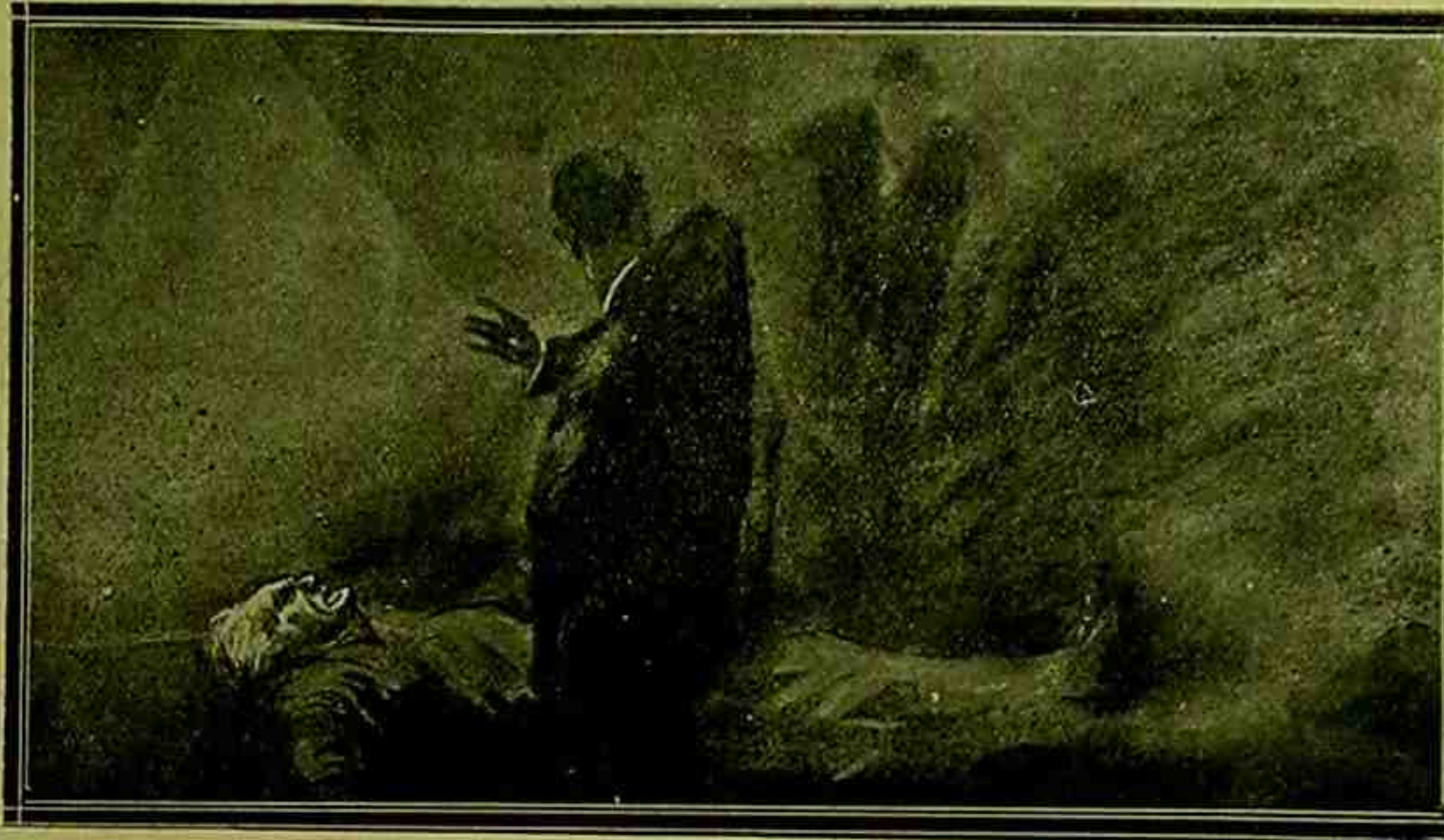
[ سنلرجه بولیس حقیقه کی بیازوق بر چوق اسرارانکیز جنایتی میدانه چیلران = هفته‌لق مجموعه = تک شایطه محوری صالح منیر بکک کین نسخه مزده ( یکی چارشیده آیوا طوطی جنایتی ) حقیقه کی خاطراتی سواقنده بولساردن . صالح منیر بکک سراق آور خاطراته شورده دوام ایندیور : ]