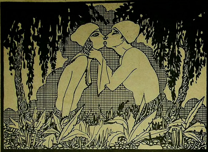
«بروسه جاشفته ویر تقد حیاتی» (ندیم)