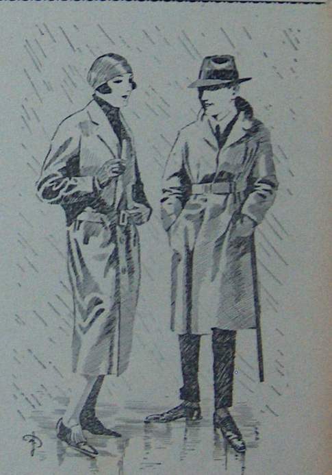
قاین — بیلیورمیکسز ، جوق قارا کتی بر حیات باشابورم ! ارکک — نمن ؟ قاین — قوتوشد قلم هب لامه‌لری سوندور بیورل !

اسکه خاطرمله ، مابوس کین برکونی ، آرتق ، اختیار قایرن حیاته کوسکوندی : کیشندی احمدکی اک نیات آتندن ، زوالی اویبوردی بریاند اجلندن !