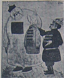
روسیه — هایدی ، شوپولنوک کورملکی آرتاکه کیی! چین — بن اونک ایچنه سیدنام، سوکرا پارچه پارچه اولورا