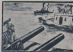
ایتالیان ردوسده فیلده پایپوروش ایتالیان — داربلا فره کوز چایی، فوشوز آنا ، شوراده اونوز فرقیلک صکر آلابی برقیشه پایپوروم ، نه دیرسک! فره کوز — هیچ ، نه میجیکم، بیلدیکی باب . بن برارله اونوز فرقی بطاربه طوب دیزپوروم . صباح اوله ، شیر اوله!