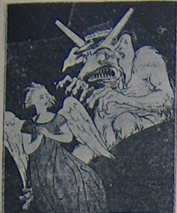
لوقارتونک ، مصوم خیالی «وهرسای» ک فورقونج خیالی تعقیب ایدیور..