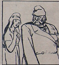
کوزه لکنه مشور! فرانسه — هایدی، سنی اوپه ده باریشلم آد. هندنیورخ — باشنه نورسکلیک..