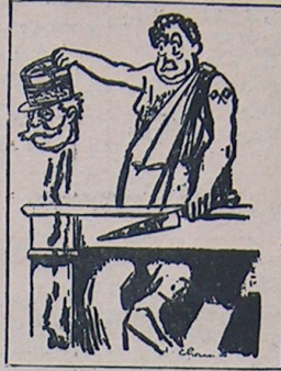
پهلووه ، فودورمش صاح مارندارلری نکلین ایچون جنرال ساری فوربان ایندی!