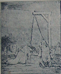
— ایس براز داما چکک ، آهده دوراجتی ، فالبا ...