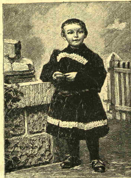
اوقومق يازمق اوكرشمش ايبي ياشنده بر المان چوجنى [ ۱۸۶ نومونك شوانته باغكر ]

اوزرنده اولوب وادول نام مهندسك تربتي اوزره انشا اولمشدر ؛ وقتيله اشبو جسرك يرنده آچياير قيساير بر ديكرى موجود ايديسه ده بر واپور كچر كن نخرىب ايلديكى جهته بويه اصول عتيقه به تكرر مراجعت اولغيه رق رسمده مشاهده اولنان اساسا سورلى كوپرى ميدانه كلشدر ؛ بونك ارتقاعى ۷۵ متره اولوب ۳۶ متره ۶۰ سانتيمتره طولنده بولنان كوپرينك كذركاهى استلديكى زمان بخار ما كنه لريه بوقارى به چقار او زمان سفان كال راحتله كچر ، ايش بيتديكى كچي كذركاه اشانغى اينوب مرور عبوره خدمت ايلبور . كذركاهك ثقات مجموعسى ۲۵۰ طونه اولوب نخرىك ما كنه سى ده بوقوته كوره يانلشدر . نخرىك ما كنه سى چفته اولوب برى دائما احتياط دورر . بوكذركاهى چككم اوزره معدنى ۳۲ ايپ واردر ، ثقاتى ده ۱۸ طونه در . كذركاهك زمان حر كتنده بر قضا وقوع بولورسه در حال حر كتنى توقيف ايتك اوزره فر ندرده موجوددر . بونلك جملسى آتلى آيد يانلشدر ، شمدي به قدر بولوده مجددارانه بر اثر كورولمه مشيدى .