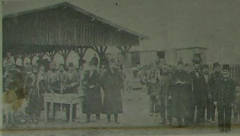
آقرهدهن اسکینره کیدرکن بقور بولن برنجی شخان موقی

اوچوجقاق حیاتی کچدی بوکون ، اوچوجقاق حیاتی شمدی بی