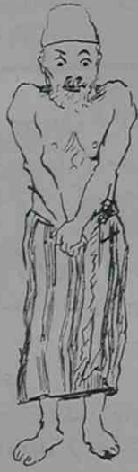
بوشقوتازه رعایتده اصرار ایدن بر آدم

خام — نه یه سکوت ایدیورسکر ؟ بك — امان خام صیقه بی ... خام — صیقه جقنی میقه جقنی وارمی ؟ کوردیکیز کپازه لکلری مطلقاً بکا اکلایه جقسکر . ( بیوک بیوک آندلروروب بینلرایده رک ) مطلقاً سولیه جقسکر .. بو عقده کولمکده قالدی ، سزگله یا شایه . به جتم ... آکلایکیز ایشمه کلیرسه عفو ایدرم . بك — شاقیه بولوشدیره رق : — یا کیزسه ... ؟ — اوزمان نه یا به جقمی بن بیلیرم .