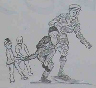
آمان صيق طو تکر تبجه آکلا شلمدجه قطعياً برا فيکر !

ايرانك مغالتي ؛ آمرقانك رياست اوپوني ؛ زاپونيانك سكوتي ؛ چينك انتباهي .