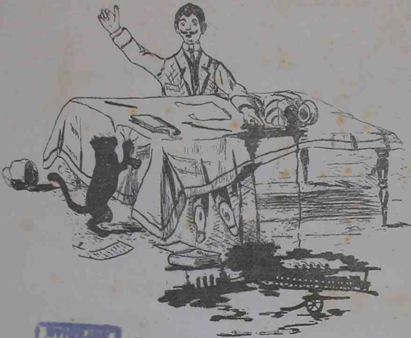
مبعوث انتخاب اولته مديفندن متولد برانفعال ايله محبر آرتق حرميشي دولييور

اوسوز شوکه : اتحادده ، اتفاقه لزوم وار بوسايه ده قياتينلر اشتايينلر ، مايرلر بز آلماسه ق نسه ليلر بيلمم عجب نه برلر هپ چورو کدر نسه مالي باشدن باشه هپ چوروک قاشلري ، انوابلري ، فسليدر بوسوروك هپ چوروکدر بوقيلير ، ايکيلير ، آلباقلر ظن ايدرم بک ياقيشدي بزه سياه قاباقلر يينيلى بز نسه مالي آلمامه بزه بوزوکون بوقوتازدر ، بوقوتازدر بزم ايچون برودوکون