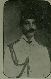
آمریکا دوختاسنده تجریه کورمک اوزره کوندرین سابلان پیکانی حق بی