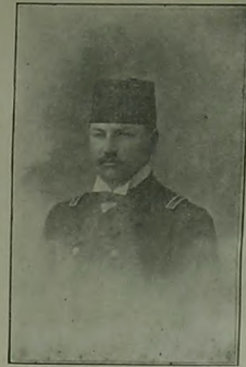
فانتام مارف بی