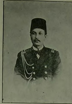
پوزایی نال اقدسی

Les officiers de la marine envoyés avec l'escadre Américaine pour faire des exercices