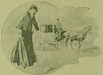
آرایه بیترکن اوله عجیب بر اداسی واردیکه . . .

اکثری تیارون چقارکن تصادف ایلدرم. آرایه بیترکن اوله عجیب بر اداسی واردیکه داغنا قارشوستده بر موقع الادی ساده آهنگ اولان او ظریف وضعی سیر ایلدرم. بر چوق زمانلر بلکزر آلفرینک اوقاق، نازک، بلک ایجه، کیدیبر رنگارنگ سولونون ولطیف اولدیهنکده باقی ایلدرم روحی بولمغ هیجانلره اولدیهان اطوارلی کوزل قانینک چهرهسی بیله مرق ایچردم. اوواردان چکلنجه بن کیدردم. فقط اک عایدینن اک کابینه قدر او قانینه باقی ایچون توقف ایشیکلری کومشدم. حلا کومرشم اولدیغ مجھول چهره حفسده معلومات آلق اوزره بر قاج کیشی همسوردم: کوزلی؟ بیلیمورلردی. چیرکیشی؟ اونی ده بیلیمورلردی. حتی ایچون دوروب آرایه شه باقدق زینده بیلیمورلردی. تیارو موسی ایلیلیور و بالکزر آرایه شه بیترکن کوردیکم قانینک چهره شه قاشو بر تخمسی حسی ایچون بالکزر اولدیهنم بختار ایلم. سروربالک آراشدنن ده نوله قارک ایشیکده کورشمشدی: سچن بهارده ایدی؛ بر صباح