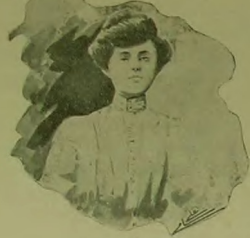
بر بخت کوزک . . .

اویقوسنی اورتن توملی بر شکر ننگ واردیکه انسان بولره باقدیبه وقت دالار، دوشونور، بو لطافت آتشد بر سر اویقوسنی، بوتون بو دویاسی منظرک بر برسی اولدیهن ایشاقی ایستر. او مهمیت آراشدنه بیاش جیسیره بوروغش اوزاق، خیالی بر چهره کورر. فقط او چهره ارشدن حقیقت یک بیلدرد. اولک مکتدی، برلیدیسی آخچ سچه بیلدیکز بیلدیزلر، او، کوردیکمز چهره ایجه آملازک، شکلسر آرزولریترک سرایدرد. حالکوه بن او سیاح فاردک کیشی بر آرایه شه بخرمشدن دکزله باقن بروجسه کوردهک اوزاقلی، اسراری ایلر بر خیال برسی تخم ایشیر بوردی.