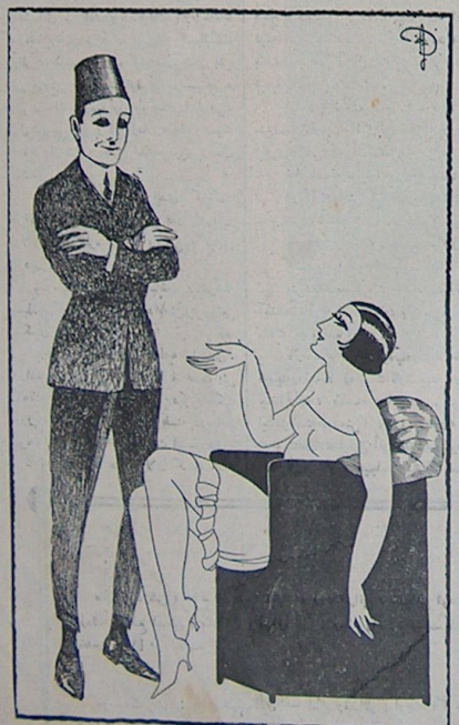
قازين — رجا ايديرم كي قنا قازين نظريه باقا ، ن بووك بر قيله مالمكدر ! ازبك — تخفينا قنج كيج سيجاق قدار ..

اوكا ، دوراسنده دائره ترمه راست كاره، بيب يكي برسوپوركه كي چكسك آتنده، كوكسك اوزينه ويلان ساري ساقال، مالي كوزلي، باشك ساع طرفه ميل ايديرش قورجه مان، قوزي دريسدن قالياني ، اندمكي كوموش سايلى قورچيله نظر دتمس چاب ايديردى. ركون ، آنتالارممن برنه ، بو آدامك كيم اولدني سوردم . — خوزكارك قايى ايدي . — نه خيدر ؟ ديم . — هيچ . ياشادرم، ميرالاسرا باشلاردن . قوزياتاني جوانده ، ركوشكي ، خزينه خانه من ماشين وار ، اوراده ، ييرب ايچوب او طورور ، بوله آرده سرمه استانبولايتر ، طولاشيره وقت كيچير . اولكونده اختياراً بو ( تپ ) ي تدقيق قوبولمق ، كندسيديه طاهشق ايچون فرست قولاوم . نهايت بر آتام ، تصادف يى عيني قوماز تپانده قازني قارشيه كيچيردى . ابتدا ياشا ، نبي ياقمدهي ذاندن سوردي . — بو ايچيندى كيم ؟ اودات نبي قديم ايدي . ياشا : — ماشالاح ! ماشالاح ! . قيه اطهار ممنونيت وآنتندن سينك قورار كي خيف بر سلامه بام بيوردير . متناقبا ، او كوئكي سيجانندن شكيت ايديلر . — بوكون حادا چوق سيقاك ! ن چوق ترلدى . اينشده وادي بيم . شاه اسلامه بزم رفوموشوايط وار . اوكا ترشمسني الناس ايتم . شاه اسلام بن قارياش دههسه ؟ شاه ! ديدى ، سن نه بيم و كلاسك ، آلاسي سه بورمه ؟ بر ماشايلى ترقيم ايديرمه دهجه سؤورا .. ديك قوزوم ؟ حق فايكز وار ياشا خسترلى . — بوق جام .. بوئر وكلا ديل .