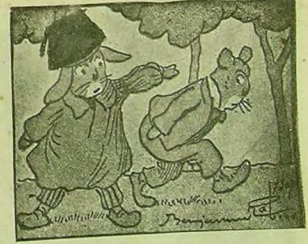
اوج دفمه نیه طانلاق قیلهرق قاجوب کیندی .

— آمان ! خیرمز وار ! کلین اوپلسنی صویتمه گلش ! بئشین ! دیبه حاقیردی . چینای طویلن پندری درحال خیرسزی طومتمه قوشدی . فقط قردهش بون کون اورماناره قوشمه آیشدیندن قولای قولای کندیسی آله ویرمیوردی . بدر حدنلنرک طینانی قالدردی وقردهش آکسه کورکنه صول ایلده بر دانه پایشدردی . قردهش بودهشلی ضربهک آلتنده