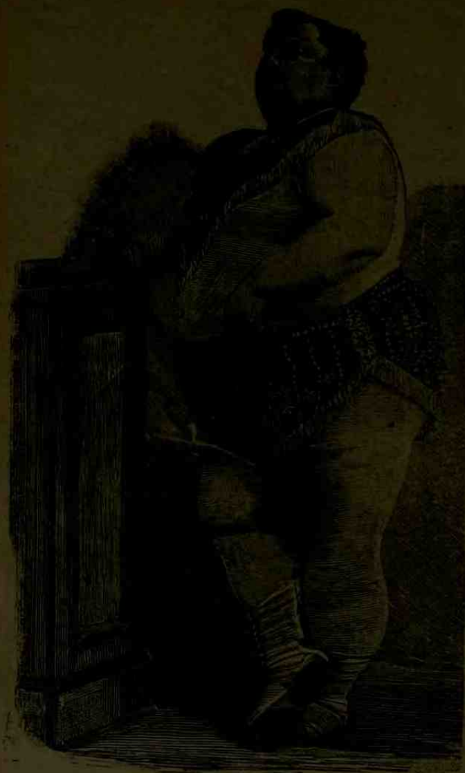
دنیاده کشیدمان بر آدم : ثعانی قیه ١٣١

— مایع ناری دیدیکیز نه اولیور ؟ بن بوندن برشی اکلابه میورم . . . . — آئی ا سن تشکل عالم حقدنه کی فرضیاتی بیامبور میدک ؟