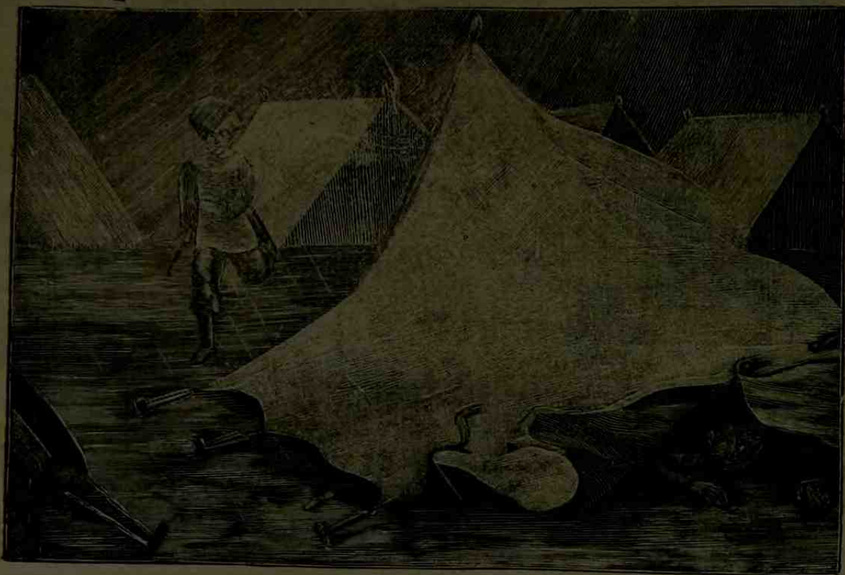
هندستانده خیمه نشین آدملر

آنك کبی اظهار علو جناب ایدنلر نزد الهیده مقبول اوله رق هر بار نعت سه ادتله متم اولغله برابر مدوح وعکس حالی التزام ایدنلر یعنی : ابنای جنسندن محتاج حمایه اولانلری قبول ایله بذل معاونت فتوتمندانه ده