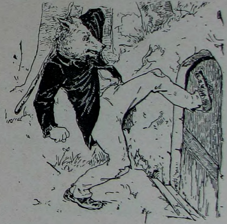
شدتلى نكهه لرله اويله كورولتولر ياپدى كه ...

خيرسر مطلقا تيلكيدى .. چونكه بو ايشي آنجق او بابا بيليردى ..