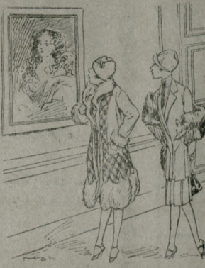
رسم سرکیستده — اوزون ساجلی بر قادن رسمی . بويله آتیقا طابولری ده سرکی به نه دیبه سوقارلر بیدم که .