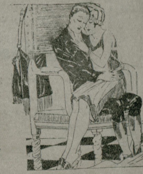
— بک آفندی ، نه ای اولش ده خدمتیجی اولشم . — نه دن ؟ — قاریکز اولسه بدم بره کلجک خدمتیجی سومردیکزده اولدم .