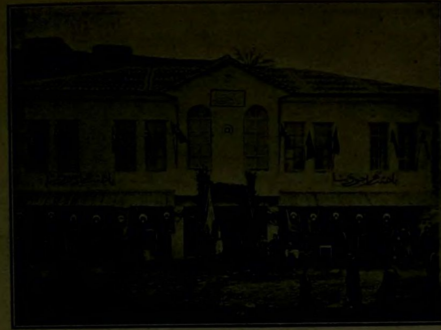
علائیہ قصبہ سندھ ولادت ہما پونہ مجدداً انشا و کشاد ایدیلان جدیدہ ابتدائیہ مکتبی

• حرکت ایلدک . خلاصہ ( ایستوول - • بالیونین ) خطی اوزرنده اجرا ایدلش • اولان تجربہ لاریغ اصولده تیور بولک • غایت مناسب سرعت شرائطی دائرہ سندھ • وکال امنیتہ بولجی وامتہ نقلیاتی ایضا • ایلیہ بیلجکفی اثبات ایلر .