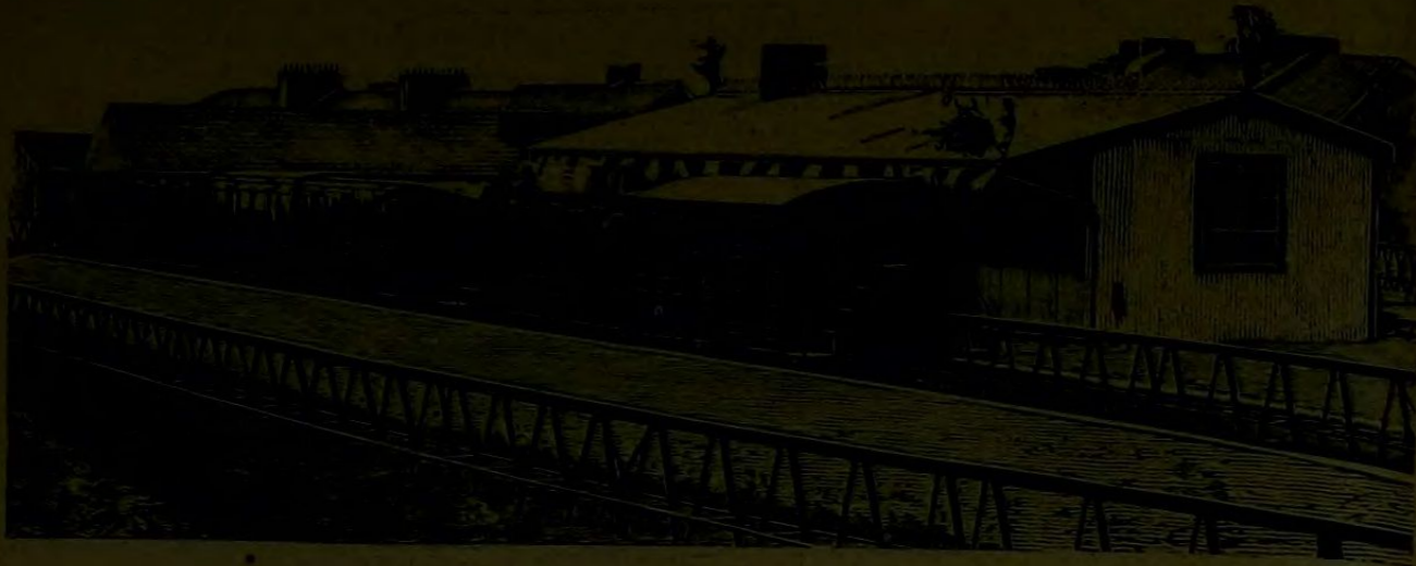
تک رایلی شمن دو فرلرندہ طاند برمرتف و قطارلرک کوردانی

اقسام اقبیہدہ یالکز لوقوموتیف ایشلمک اوزرہ کور عربہ سنک ارقستدن اعتباراً جر اولنان قتلک مقصداری یوز یتمش طونیلاتودر . یکرمی میلیترو میلندہ بریقوش اوزرنده کور عربہ سنک ارقستندہ جر