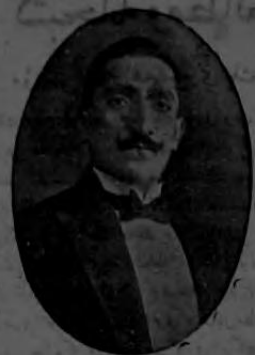
قومیق شهر ناشد بک

اوزمان بی قنابه ناک اوزرینه اولور تهرق . آلر می آلمی ایچنه آلدی : — های اوزون اوزون بخت ایدیکم « مارشونا » بوقی دیدی . ایشته بشکک دیبیکم او ... بن : — آ ... دیدم . دیک ازدواج ... او ، باشی عنودانه ساللایرق : — بو ... بر سنک قدر عجول دکیل ؛ دیدی . بالکنز اشتراک حیات . هکبه لده کوزله بری بویا طوندق . سنک آبرجه اودنک وار . سنی اوقدر مدح که عالمک طرز تشکلدن بخت ایتمش اولسه بدک مأموریتی تریکه برابر کله جکدک . بیله ک اوقدر مسودم که ... بن : — فقط ازدواج ؟ دیدم . — آ ... ایشته اونک لایق دیدی بیه سعادتنی ضعیف لایقور . نه ایسه ؛ نه وقت کایرسک ؟ معلوم آ ... ایکی بیک غروشه صقیه حیاتی آلا رفاهاتی قبوله مجبور ایدی . هانکی آقام کله حکک برکون اول بیلدر . حاری سیکر ایدر . اکر ای بک سه ور . فقط حاضر لقی کورمه دن سافردن خوشلافاز . علی ساجد ، لاقردی سوبله مکده فوق العاده بر سهولک حسن ایدنله مخصوص بر اطرا د کلامه نیا دیا سوبله یوردی . اودقیقه بن ایچین حاضر لانا اودا فکری تشویر ایدی . بون ایچین اولان بر اودا ؛ ایکی اوچه اولایلیردی . همین صوردم : — قیصین نیا بیچک ؟ ... — شیشله ... اوچ سنه سوکرا نادیه ایدلک اوزره مهم برمیلع اده ایدیدورم . سوکر اسیک کلن موقت بودجه ایچینی اویوتله تلاق . نه او ؟ ... ک مراقبه سو رو برسک . قیصن کیه لری اکلنجه دوشونشی وار ؟ ... — بوق ؟ دیدم . آدابه کلدیکم زمان قیص ایچین آبرجه کوروشوروز . بر بریزی ای طانیدیشز ایچین ... بر آرز سوکرا سنیدن بخت ایدی : — ناصیل : .. دیوردی . عینی بنا ایچنده بری بریکزدن سو تو بویوسکو ، بوفه ترقی وادی ؟ اوراسی مهم دکیل ؛ دیدم . مهم وقطنی برشی و لره ازدواج ... اوردن : — بدلاسک ایدی . ممکن — مایهدی وار . ند بر سئول سعادت علی سحاحیان مصلحه سی